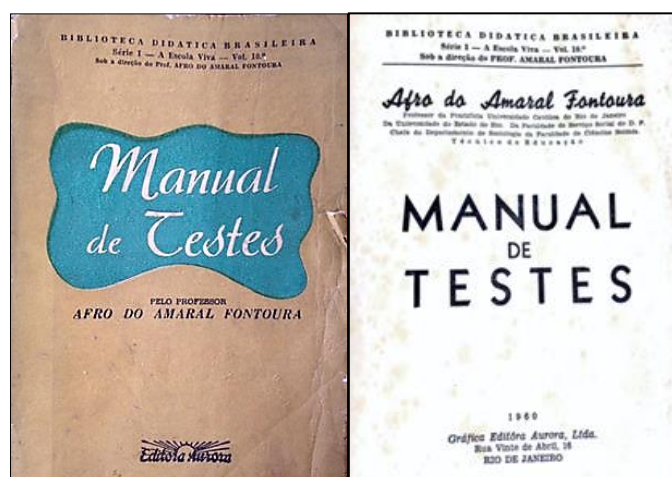
Figura 2: Capa e contra capa do Manual de testes